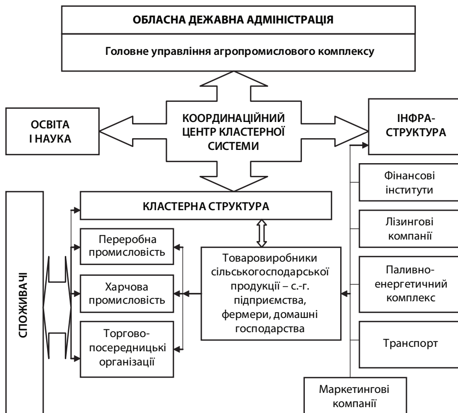
Рис. 2. Схема взаємодії суб'єктів кластерної системи АПК району

У молочнопродуктових і цукрових підкомплексах, в яких сільськогосподарські товаровиробники отримують продукцію-сировину, яка до споживача доходить після переробки, посередників і торгівлі, доцільно будувати кластер по Шотландській моделі. Кластери картопляного та овочевого виробництва як сфери малого і середнього