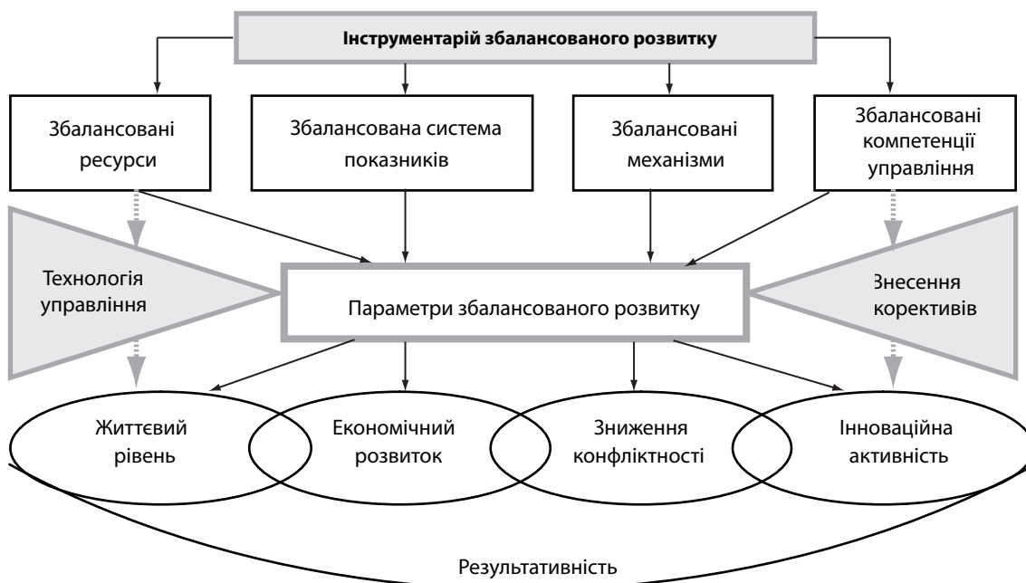
Рис. 2. Модель забезпечення збалансованого розвитку нових районів

Субурбанізаційна стратегія в моделі укрупнення районів не відпрацьована, вона ще потребує своєї розробки, але вже в постановочному плані можна визначити деякі її характеристики і особливості.