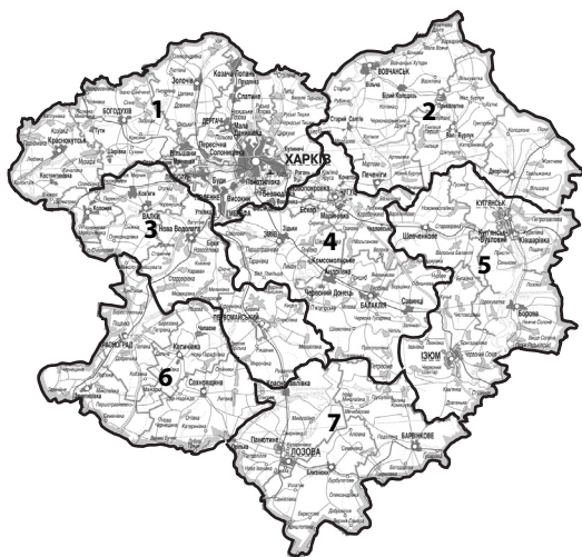
I – 7 районів