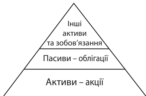
Рис. 3. Поєднання 1-го та 2-го принципів фінансової стійкості інвестиційного фонду

Об'єднуючи перший і другий принципи фінансової стійкості інвестиційного фонду, схематично їх можна зобразити так (рис. 3).