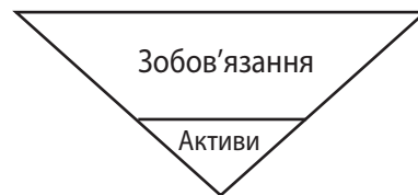
Рис. 2. Схема співвідношення активів і пасивів будови шахрайської фінансової піраміди

За обсягами вкладів інвестори 2-ї, 3-ї, 4-ї та подальших черг (хвиль) мають переважати відповідні вклади попередників. Відповідна схема (див. рис. 1) тримається на особах-інвесторах та їхніх вкладах, а не на реальних бізнес-процесах, що створюють додану вартість. До того ж, внески інвесторів не йдуть на придбання активів, внаслідок чого обсяги зобов'язань зростають, а обсяг активів не збільшується (рис. 2).