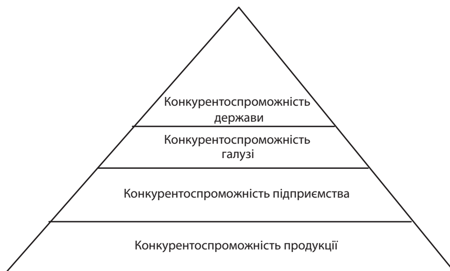
Рис. 2. Рівні конкурентоспроможності

що якщо підприємство прагне бути конкурентоспроможним, воно має випускати конкурентоспроможну продукцію та функціонувати в конкурентоспроможній галузі; якщо держава прагне розвивати економіку, вона має формувати сприятливі умови для функціонування підприємств. Як наслідок, досить часто проблемою низького рівня конкурентоспроможності вітчизняних підприємств та їх продукції є низький рівень конкурентоспроможності вітчизняної економіки.