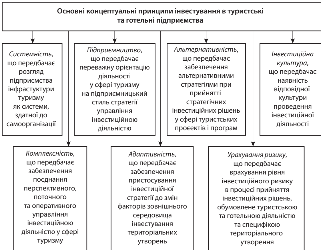
Рис. 2. Основні концептуальні принципи інвестування у сфері туризму