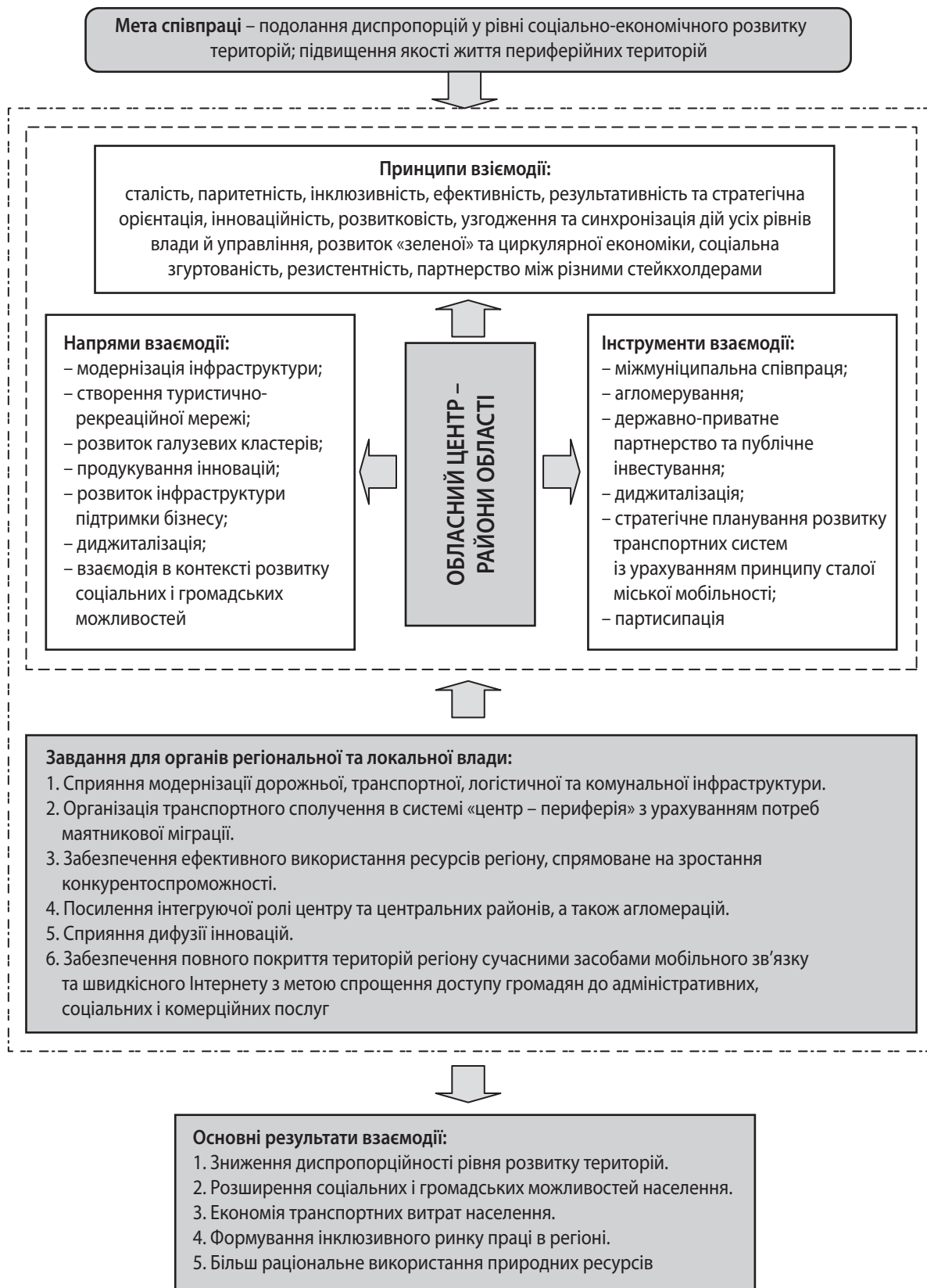
Рис. 1. Концептуальний підхід до підвищення центр-периферійної взаємодії обласного центру та районів області на сучасному етапі децентралізації