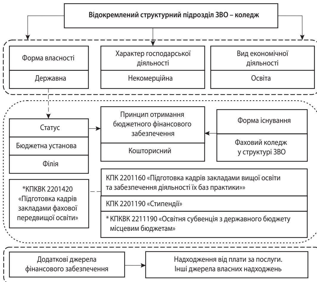
Рис. 3. Ознаки, що характеризують заклад фахової передвищої освіти – відокремлений структурний підрозділ ЗВО