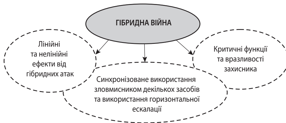
Рис. 2. Аналітична модель розуміння гібридної війни