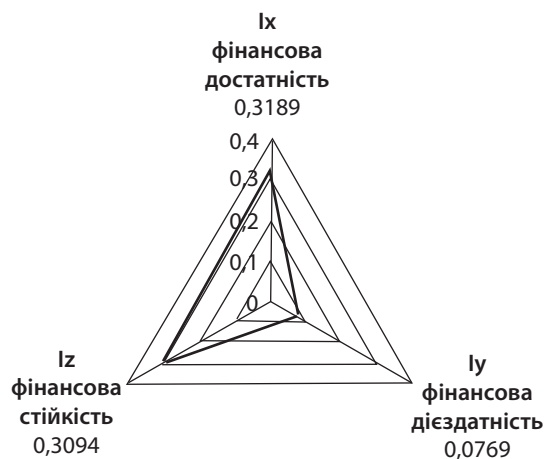
Рис. 4. Середній рівень фінансової достатності, дієздатності та стійкості місцевих бюджетів

Темп зростання фінансової дієздатності місцевих бюджетів за період 2006 – 2012 рр. засвідчує значне зменшення бюджетного потенціалу за рахунок скорочення валового регіонального продукту до рівня доходів і витрат місцевого бюджету, темпів зростання видатків місцевих бюджетів на душу населення, доходів місцевих бюджетів