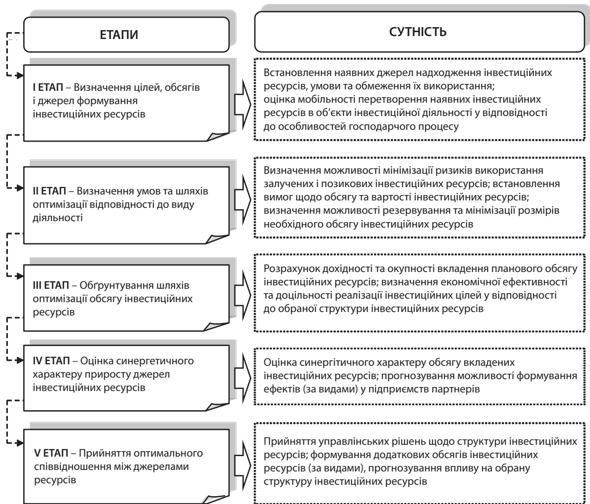
Рис. 2. Процес оптимізації розміру інвестиційних ресурсів на підприємствах малого бізнесу

1 група – підприємства, активи яких переважно формуються за рахунок приросту власних інвестиційних ресурсів (сільське господарство, мисливство, лісове господарство, фінансова діяльність, готельне господарство, діяльність транспорту на зв'язку);