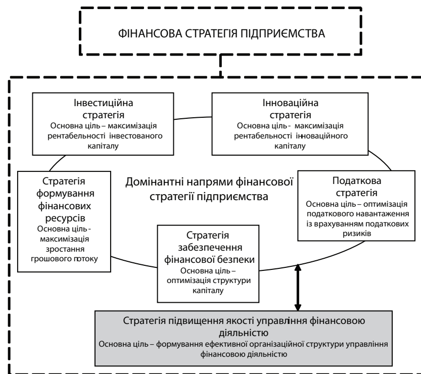
Рис. 2. Основні компоненти фінансової стратегії підприємства