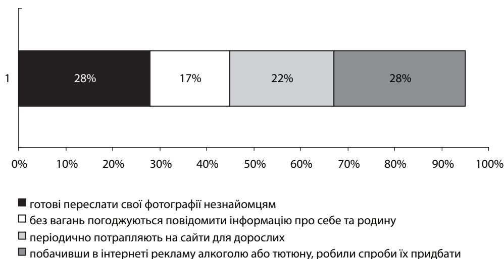
Рис. 2. Результати всеукраїнського соціологічного дослідження «Знання та ставлення українців до питання безпеки дітей в Інтернеті»

Якщо суспільство хоче уберегти дітей від мультимедійної залежності, воно мусить насамперед впливати