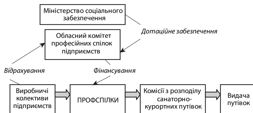
Рис. 1. Механізм фінансового забезпечення і розподілу санаторно-курортних путівок за радянських часів

За часів незалежності України цю систему було зруйновано, профспілки втратили свою значущість. З метою відтворення соціальної підтримки населення Верховною Радою 18 січня 2001 р. був затверджений Закон України № 2240-III «Про загальнообов'язкове державне соціальне страхування у зв'язку з тимчасовою втратою працездатності та витратами, зумовленими похованням». Згідно із преамбулою цього Закону він «...визначає правові, організаційні та фінансові основи загальнообов'язкового державного соціального страхування громадян на випадок тимчасової втрати працездатності, у зв'язку з вагітністю та пологами, у разі смерті, а також надання послуг із санаторно-курортного лікування та оздоровлення застрахованим особам та членам їх сімей» [2, с. 3]. У зв'язку з прийняттям цього закону 31 березня 2001 р. був створений Фонд соціального страхування від нещасних випадків на виробництві та професійних захворювань України (ФСС).