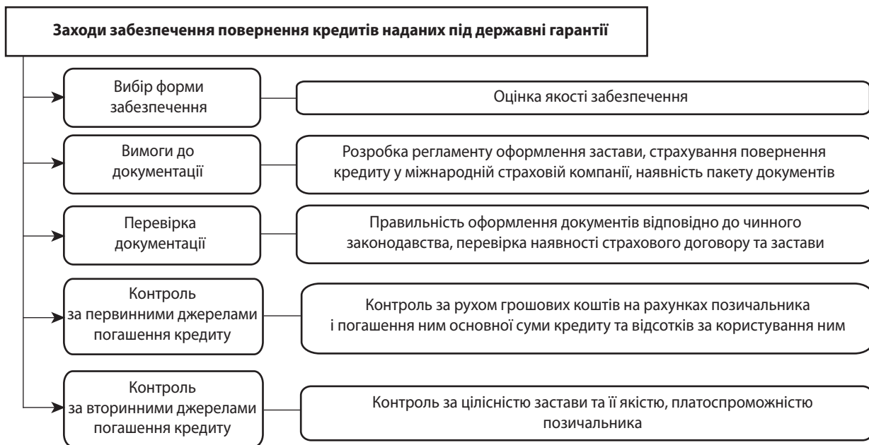
Рис. 2. Заходи забезпечення повернення кредиту, наданого під державні гарантії

Досвід зарубіжних країн засвідчує, що створення банку розвитку для контролю за державною інвестиційною діяльністю дасть можливість підвищити ефективність кредитування. Так, у Німеччині існує Банк реконструкції і розвитку Німеччини (KfW) [8], а у Польщі – Банк народного господарства (BGK) [9]. Саме на банки розвитку покладаються обов'язки зі створення ефективної інфраструктури державного кредитування. Що ж стосується банку розвитку, то в Україні існує Український банк реконструкції та розвитку, який не виконує всіх функцій державного банку розвитку в силу комерційної спрямованості. Проте, саме на його базі у перспективі планується створення Українського банку розвитку [10], метою діяльності якого стане підтримка довгострокового фінансування суспільно значущих проектів, що сприяють економічному зростанню, розвитку економіки та вирішенню соціальних завдань.