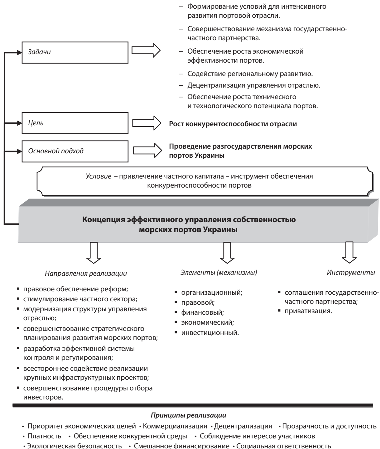
Рис. 1. Структурная схема концепции эффективного управления собственностью морских портов Украины