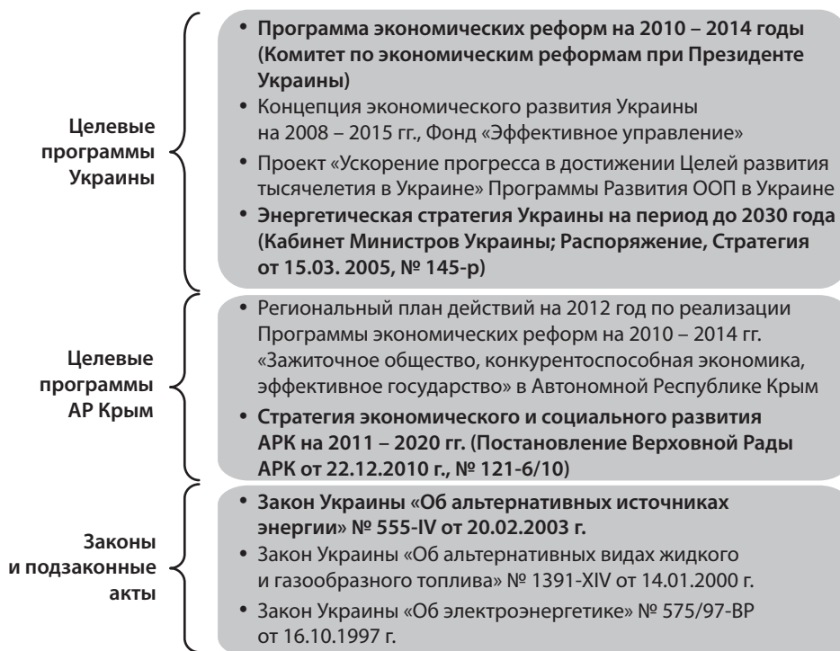
Рис. 1. Правовое регулирование политики энергосбережения

В настоящее время в развитии нетрадиционной и возобновляемой энергетики удалось достигнуть впечатляющих результатов. В последние годы развитыми странами была разработана правовая база, согласно которой энергоснабжающие компании обязаны принимать энергию, вырабатываемую нетрадиционными источниками. Кроме того, разработаны программы по экономической поддержке производства энергии ВИЭ в Украине и Крыму (рис. 1). Появились хорошо финансируемые проекты, на которые ежегодно в мире тратятся огромные средства. С каждым годом все больше стран начинают развивать производство энергетики с ВИЭ. В итоге спрос на оборудование для электростанций, работающих на возобновляемых источниках энергии, постоянно растет, а цены на электроэнергию, выработанную на них, неуклонно приближается к ценам, устанавливаемым на энергию, полученную из традиционных видов топлива [2, 3].