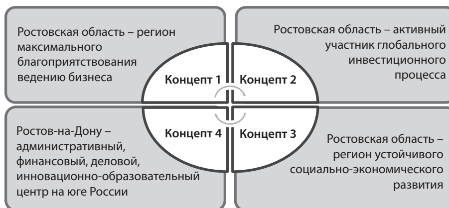
Рис. 2. Концепты государственной политики развития инвестиционной сферы Ростовской области

2. Борьба с административными барьерами – оптимизация сроков, порядка прохождения и обеспечения прозрачности различных процедур согласования инвестиционного проекта, дальнейшая реализация принципа «одного окна» в целях исключения или минимизации участия пред-