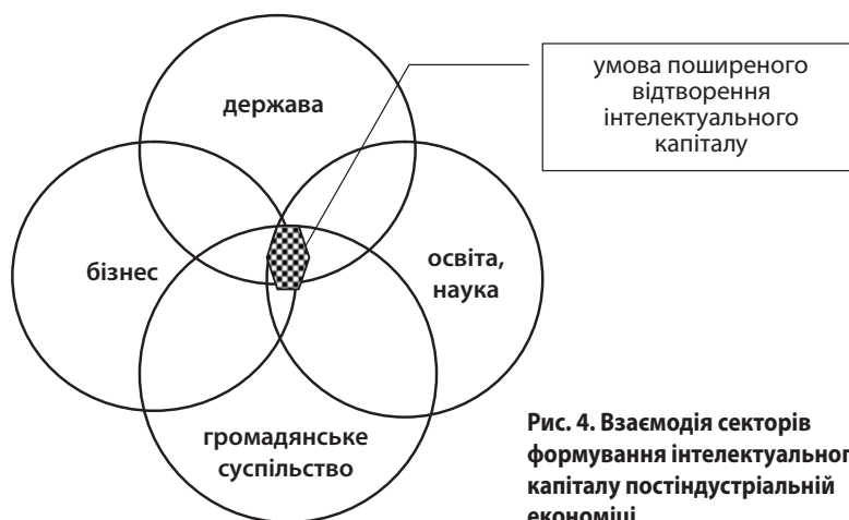
Рис. 4. Взаємодія секторів формування інтелектуального капіталу постіндустріальній економіці

Значна кількість проблем формування та розвитку вітчизняного інтелектуального капіталу пов'язана зі слабкістю природних зв'язків необхідних інститутів й акторів його функціонування. Компанії, вищі навчальні заклади, Національна академія наук існують незалежно, мають влас-