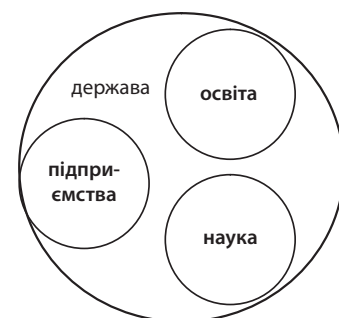
Рис. 1. Взаємодія освіти, науки та підприємств у командно-адміністративній економіці

Етапу командної економіки відповідає співіснування освіти, науки та виробничої діяльності в монополізованому державному просторі (рис. 1).