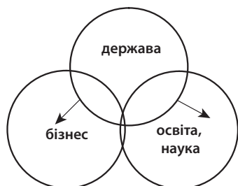
Рис. 3. Взаємодія освіти/науки, бізнесу та держави в сучасній українській економіці

Для пострадянського періоду розвитку української економіки були характерні неповноцінні подвійні спіralі взаємин акторів формування інтелектуального капіталу – держава – бізнес і держава – освіта / наука – з явним домінуванням держави над наукою та бізнесом за відсутності зворотних зв'язків (рис. 3). Ця ситуація блокує розвиток інтелектуального капіталу.