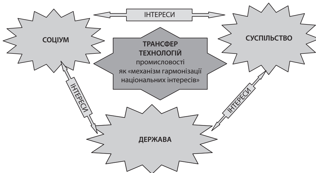
Рис. 2. Трансфер технологій промисловості як механізм гармонізації національних інтересів з позиції часу та простору (розроблено автором)

свою технологічну першість, якщо будуть в змозі освоїти стратегічно правильну модель інноваційного саморозвитку – активне втручання в процес власної зміни, алгоритм «зміни змін», нелінійний, непередбачуваний, що не виражався в звичних показниках процесу» [1].