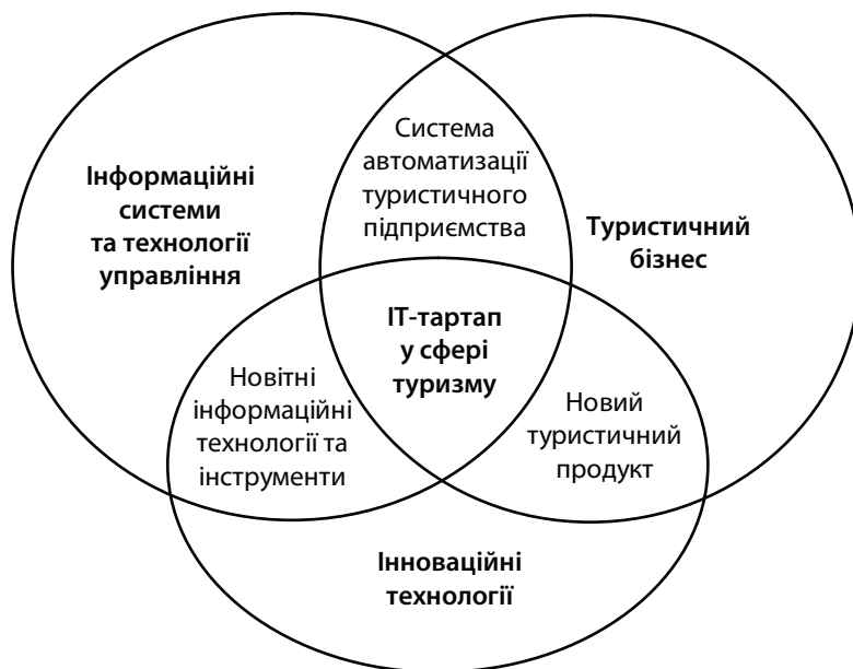
Рис. 2. Базис розробки інноваційних ІТ-проектів у сфері туризму

технологій є одним із першочергових завдань перспективної та інноваційної індустрії туризму.