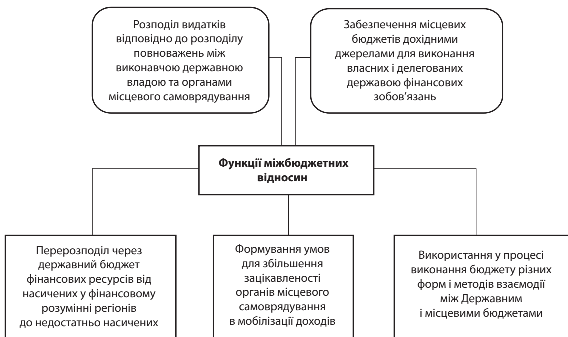
Рис. 1. Функції міжбюджетних відносин в Україні

За таких умов підставою для існування міжбюджетних відносин є: визначений у законодавстві розподіл повноважень між державною виконавчою владою та органами місцевого самоврядування; гарантія фінансування витрат на реалізацію наданих повноважень з боку