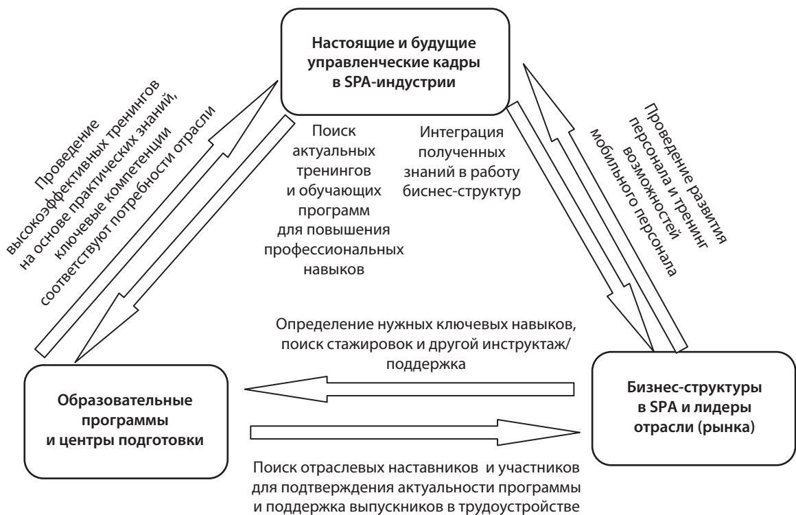
Рис. 2. Система управления персоналом в Spa-индустрии

В недрение и развитие данной системы управления персоналом в Spa-индустрии позволит аккумулировать полученные знания и опыт в отрасли, что приведет к стабильному росту показателей эффективности управленческого персонала и его высокой адаптивности к изменениям внутренней и внешней среды.