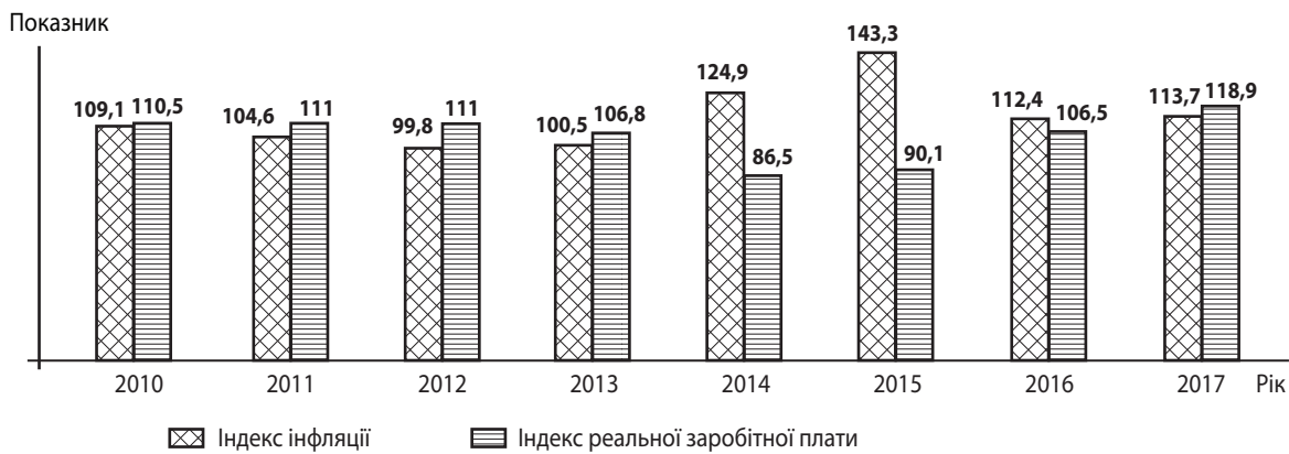
Рис. 3. Динаміка реальної заробітної плати й індексу інфляції