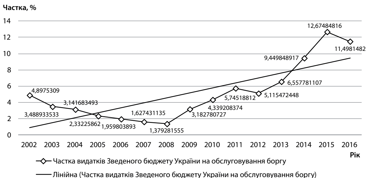
Рис. 1. Динаміка частки видатків Зведеного бюджету України на обслуговування боргу у 2002–2016 рр.

Згідно з даними табл. 4, за період 2007–2016 рр. у загальній структурі видатків Зведеного бюджету України переважають поточні видатки, що становлять 30,8% валового внутрішнього продукту. Капі-