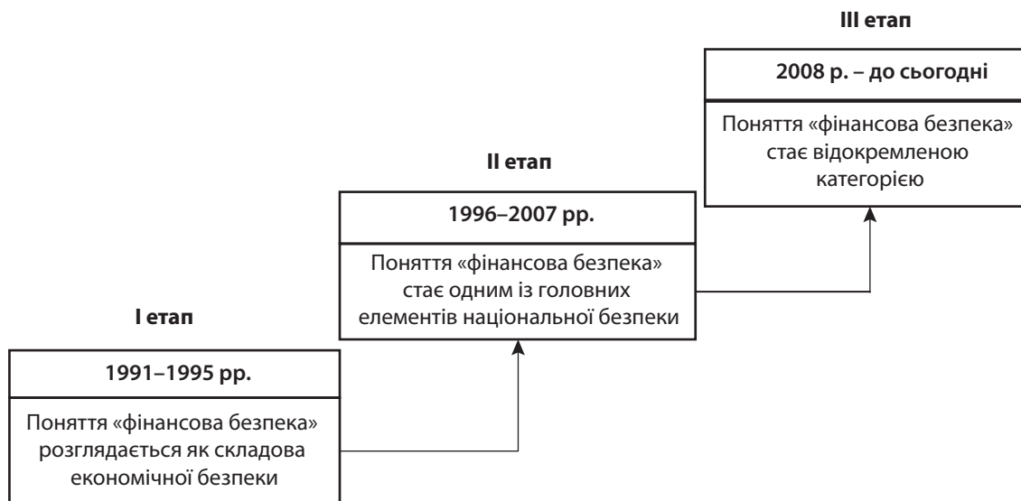
Рис. 1. Етапи еволюції поняття «фінансової безпеки»

Отже, дана категорія пройшла три головні етапи становлення, і з кожним наступним періодом її значущість ставала все більшою. На сьогодні фінан-