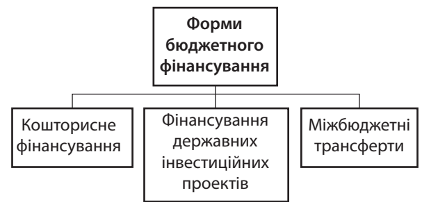
Рис. 1. Класифікація форм бюджетного фінансування

його форм. Зауважимо, що бюджетне фінансування здійснюється в кількох формах. У науковій літературі виділяють такі (рис. 1).