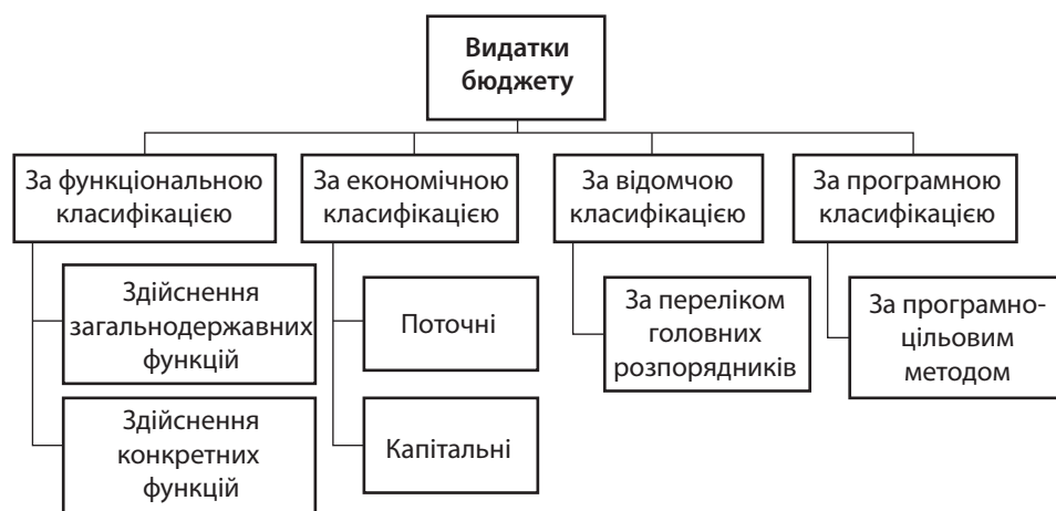
Рис. 2. Класифікація видатків державного бюджету

Головними пріоритетами державного бюджету є видатки на оборону, охорону здоров'я, освіту та соціальну сферу, які протягом даного періоду дослідження зазнали доволі значних змін. На охорону здоров'я у 2016 р. планувалося виділити 11,3 млрд грн, що на 4,1 млрд грн та 8,6 млрд грн менше, ніж у 2017 та 2018 рр. відповідно. Щодо фінансування галузей