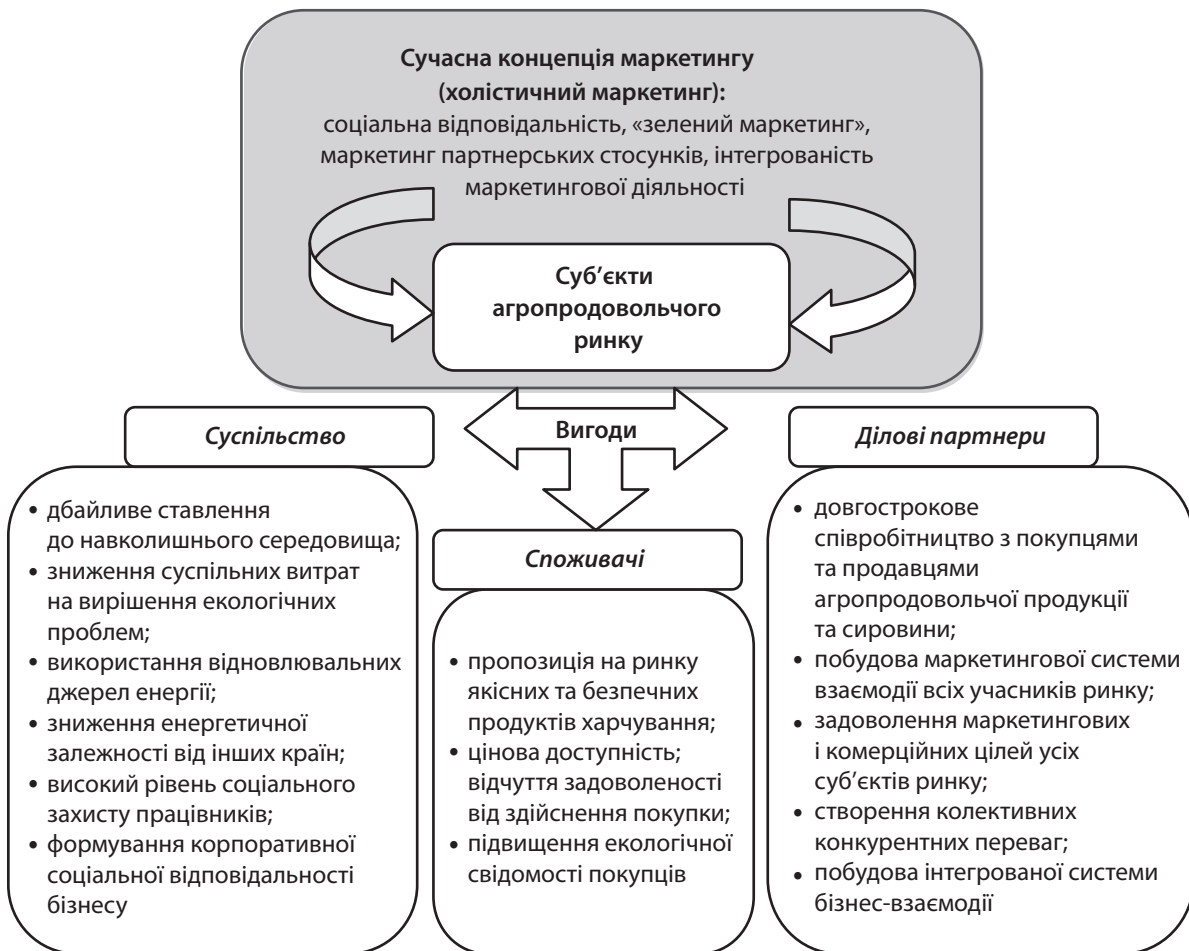
Рис. 3. Сучасна маркетингова концепція агропродовольчого ринку

5. Витрати і ресурси домогосподарств України у III кварталі 2018 року (за даними вибіркового обстеження умов життя домогосподарств України). URL: http://www.ukrstat.gov.ua/