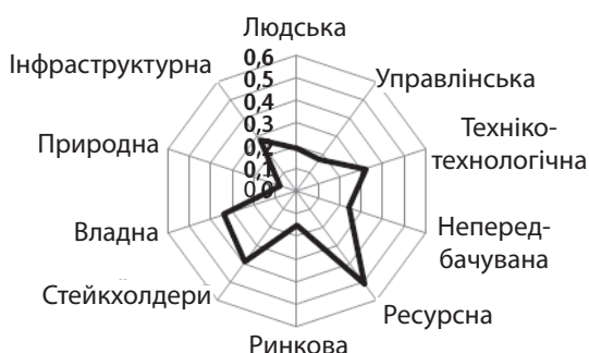
Рис. 4. Результати розрахунку інтегрального показника економічної безпеки підприємства № 3