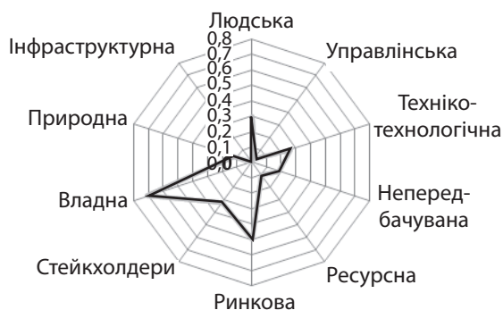
Рис. 2. Результати розрахунку інтегрального показника економічної безпеки підприємства № 1