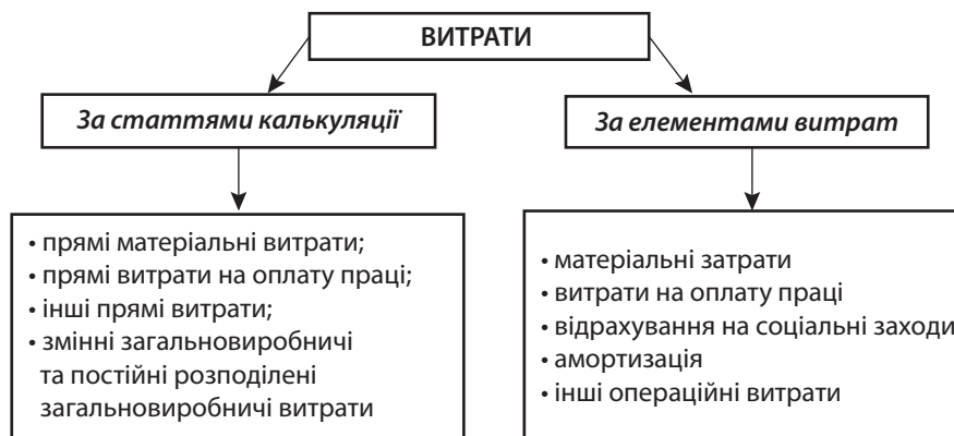
Рис 1. Класифікація витрат за П(с) БО 16