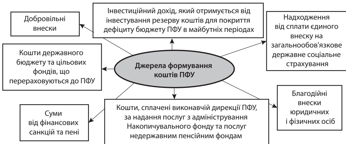
Рис. 1. Джерела надходження до Пенсійного фонду України