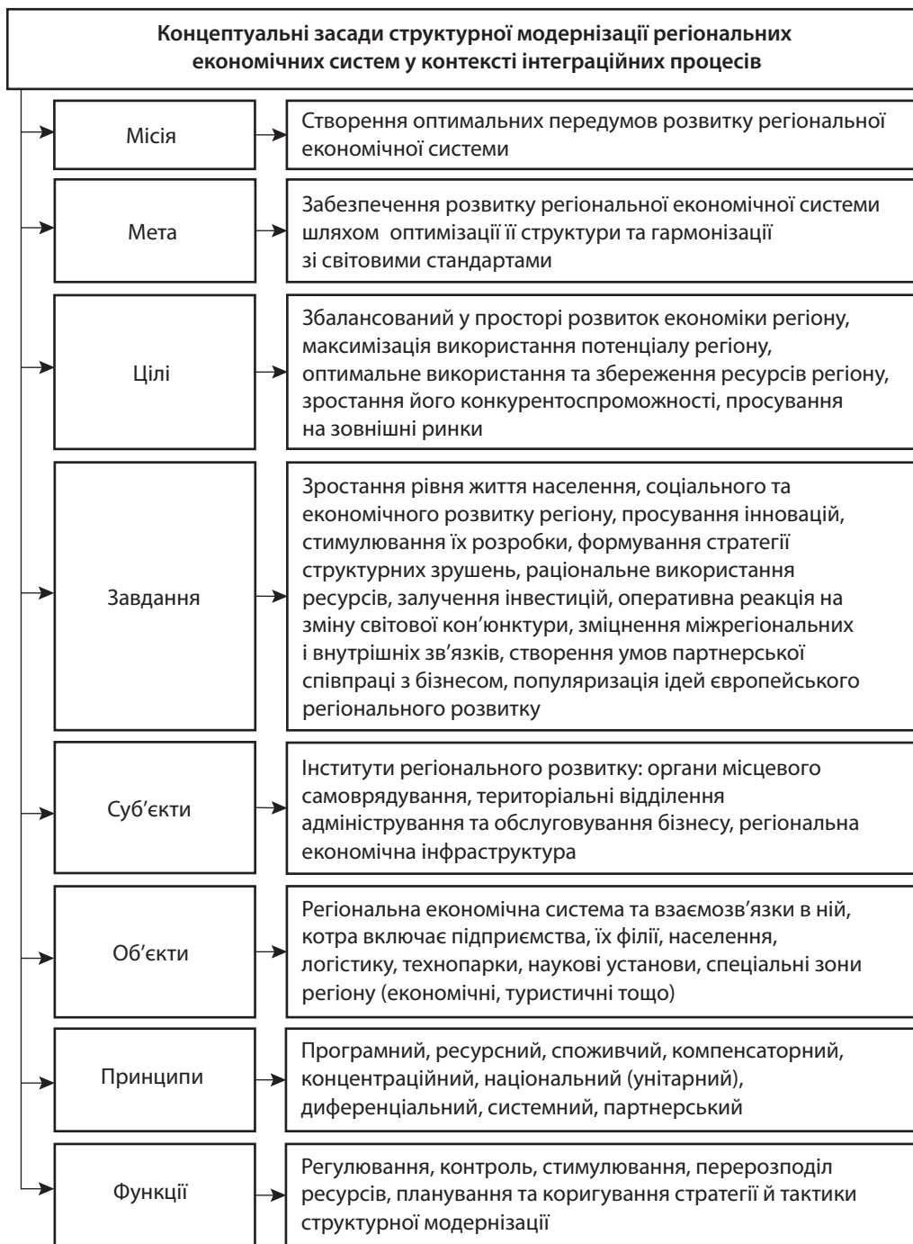
Рис. 2. Концептуальні засади структурної модернізації регіональних економічних систем у контексті інтеграційних процесів

Кобзистий М. [19] і Луцков В. [20], розглядаючи структурні перетворення в економіці, у т. ч. на рівні регіонів, також акцентують увагу на ролі державної політики в розвитку регіональних економічних систем, що знайшло відображення і в нашому дослідженні.