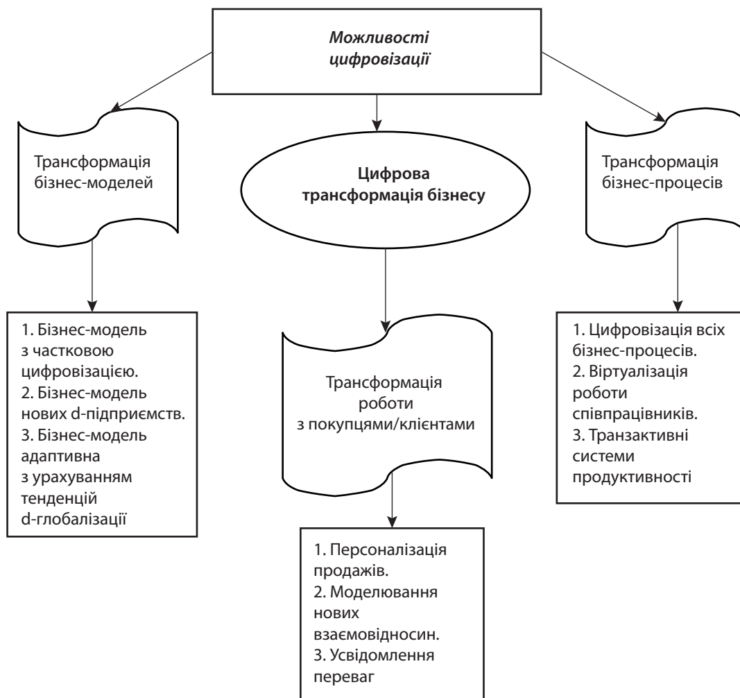
Рис. 1. Модель цифрової трансформації бізнесу

Сьогодні в Україні однією з найбільш значних трансформацій, яку зараз переживає світ бізнесу, є прогресивний розвиток і впровадження Інтернет-торгівлі. Особливо це стосується торговельних організацій або тих підприємців, які займаються торговельною діяльністю. «Кожного дня все більше підприємств різних країн у всьому світі впроваджують у свою діяльність інструменти електронної комерції, що дозволяє їм залучати нових клієнтів та, відповідно, нарощувати прибуток. Не виключенням є і сфера торговельних відносин, яка, на сьогоднішній день, активно переміщується в он-лайн світ» [6, с. 126].