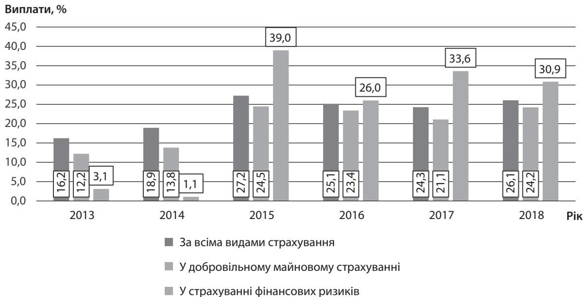
Рис. 3. Рівень виплат на ринку страхових послуг України протягом 2013–2018 рр., %

за рахунок операцій перестрахування, а введення податку на перестрахування в нерезидентів, рейтинг фінансової надійності яких не відповідає законодавчо встановленим вимогам [5], сприяло також тому, що страховики почали надавати перевагу операціям