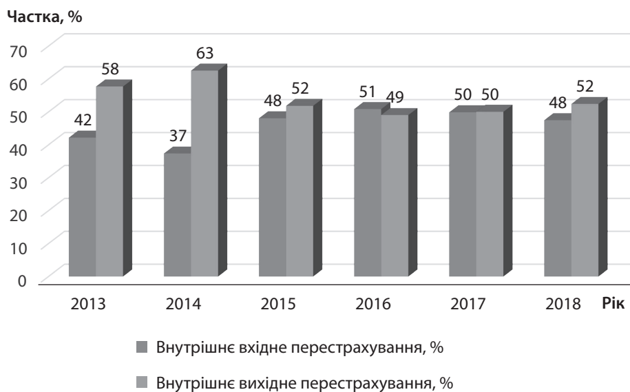
Рис. 5. Співвідношення часток вхідного та вихідного перестраховання на внутрішньому перестраховому ринку, %