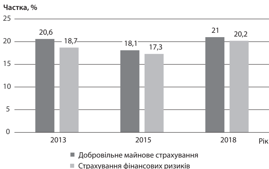
Рис. 4. Частка добровільного майнового страхування та страхування фінансових ризиків у вихідному перестрахованні, %