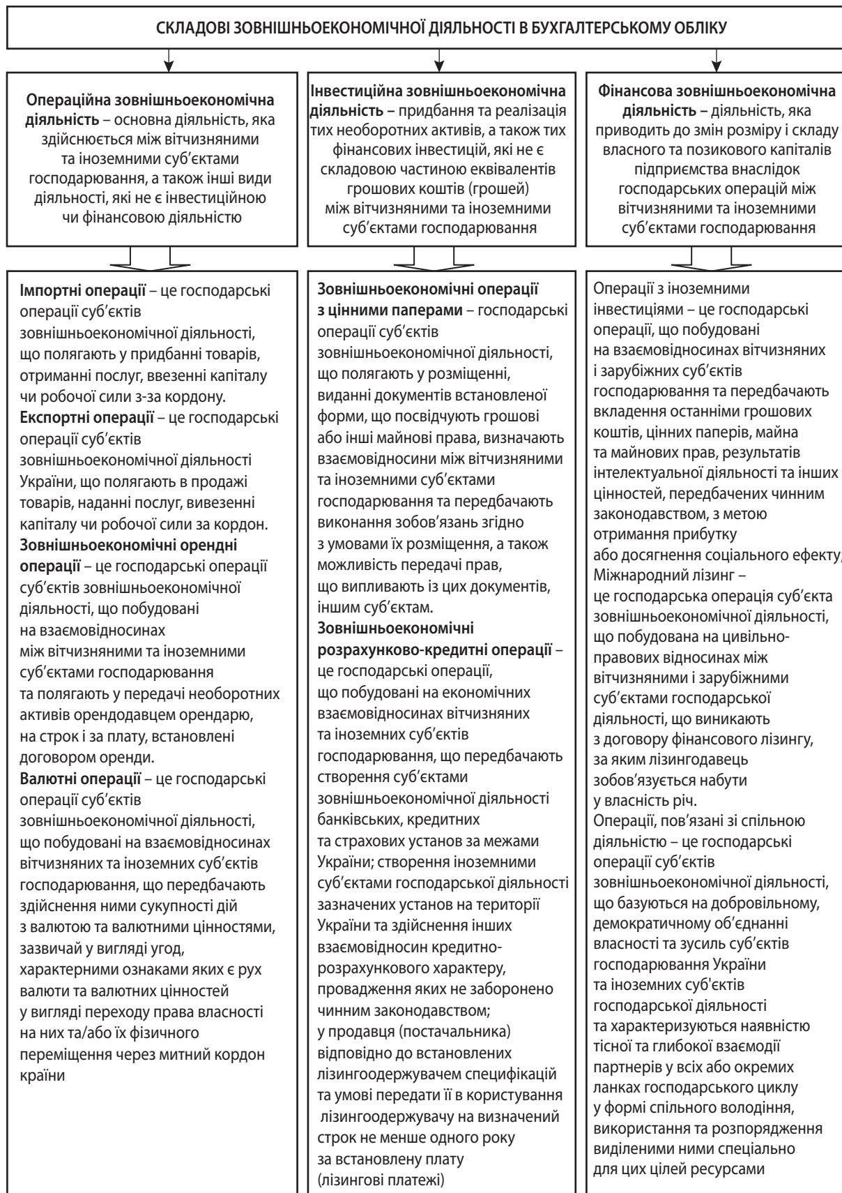
Рис. 2. Складові зовнішньоекономічної діяльності в бухгалтерському обліку