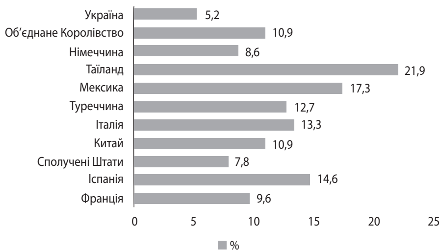
Рис. 1. Внесок туризму у світовий ВВП, % за найпопулярнішими туристичними маршрутами

Найбільшого скорочення зазнали Азійсько-Тихоокеанські країни, де кількість міжнародних туристичних прибуттів зменшилася на 82%, на Середньому Сході – на 73%, в Африці – на 69%, в Європі та Америці – на 68%. В Європі найбільших втрат зазнали країни Центральної, Східної, Південної та Північної частин, зокрема: Румунія та Молдова – 82%, Північна Македонія, Боснія і Герцеговина, Кіпр і Чорногорія – 84%; Швеція – 74%; Норвегія – 76% та Ісландія – 79%. Варто зазначити, що за січень – лютий 2020 р. спостерігалось зростання міжнародних туристичних прибуттів у Ліхтенштейн (+17 і 26%), Сан-Марино (+55 і 42%), Грецію (+20 і 25%) та Норвегію (+12 і 17% відповідно) [11].