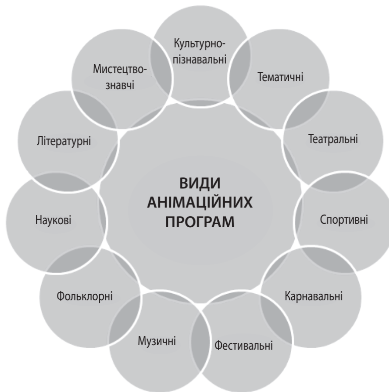
Рис. 3. Види анімаційних програм у туризмі

інформація гості можуть побачити на інформаційних стендах, спитати у гіда або працівника цього готелю.