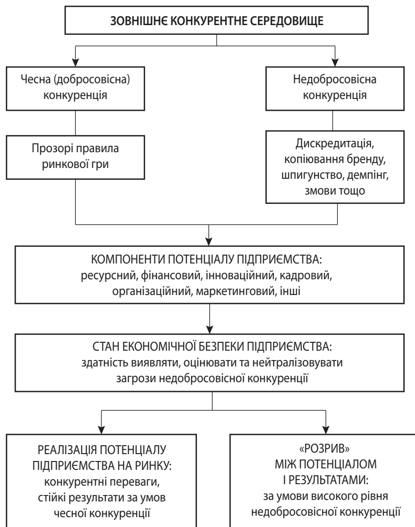
Рис. 3. Системний взаємозв'язок формування потенціалу підприємства, економічної безпеки та недобросовісної конкуренції

чуток про можливе банкрутство, знижує рівень лояльності працівників, зумовлює зростання рівня плинності персоналу та ускладнює процес залучення висококваліфікованих спеціалістів. Унаслідок цього навіть розвинений кадровий потенціал частково втрачає свою функціональну спроможність через зростання невизначеності та дефіцит довіри.