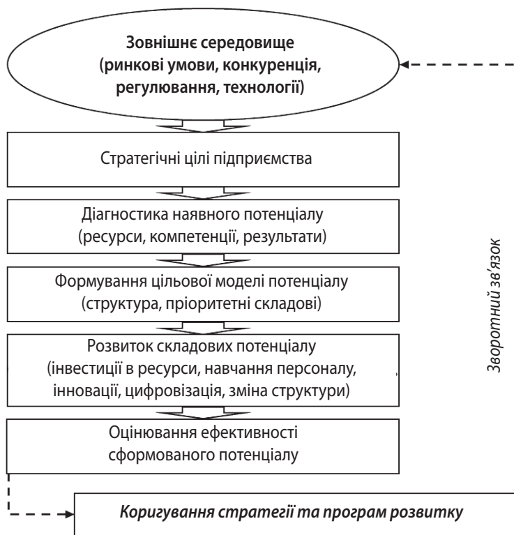
Рис. 1. Динамічна схема процесу формування потенціалу підприємства

По-третє, принцип адаптивності ґрунтується на необхідності урахування змін зовнішнього середовища та здатності потенціалу змінюватися у відповідь на нові виклики. У цьому аспекті особливо важливими стають інноваційний, організаційний та інформаційний потенціали, які забезпечують гнучкість бізнес-моделі, оперативність ухвалення рішень і спроможність підприємства до постійного навчання.