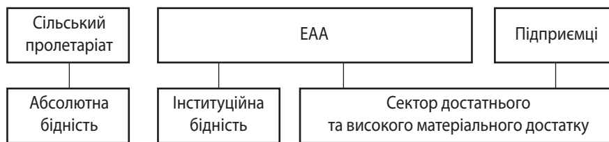
Рис. 3. Співвідношення статусу агентів аграрного соціуму за критеріями економічної активності та майновим критерієм

Щ одо взаємозв'язку агентів обох статусів, наші спостереження показують наявність певної відповідності (рис. 3): сільський пролетаріат виникає та існує виключно в секторі абсолютної бідності, тоді як підприємці асоційовані із сектором високого матеріального достатку. У сучасних умовах українського сільського соціуму група економічно активних агентів зазвичай співвідноситься із секторами «сірої зони» (інституційної бідності) та високого матеріального достатку.