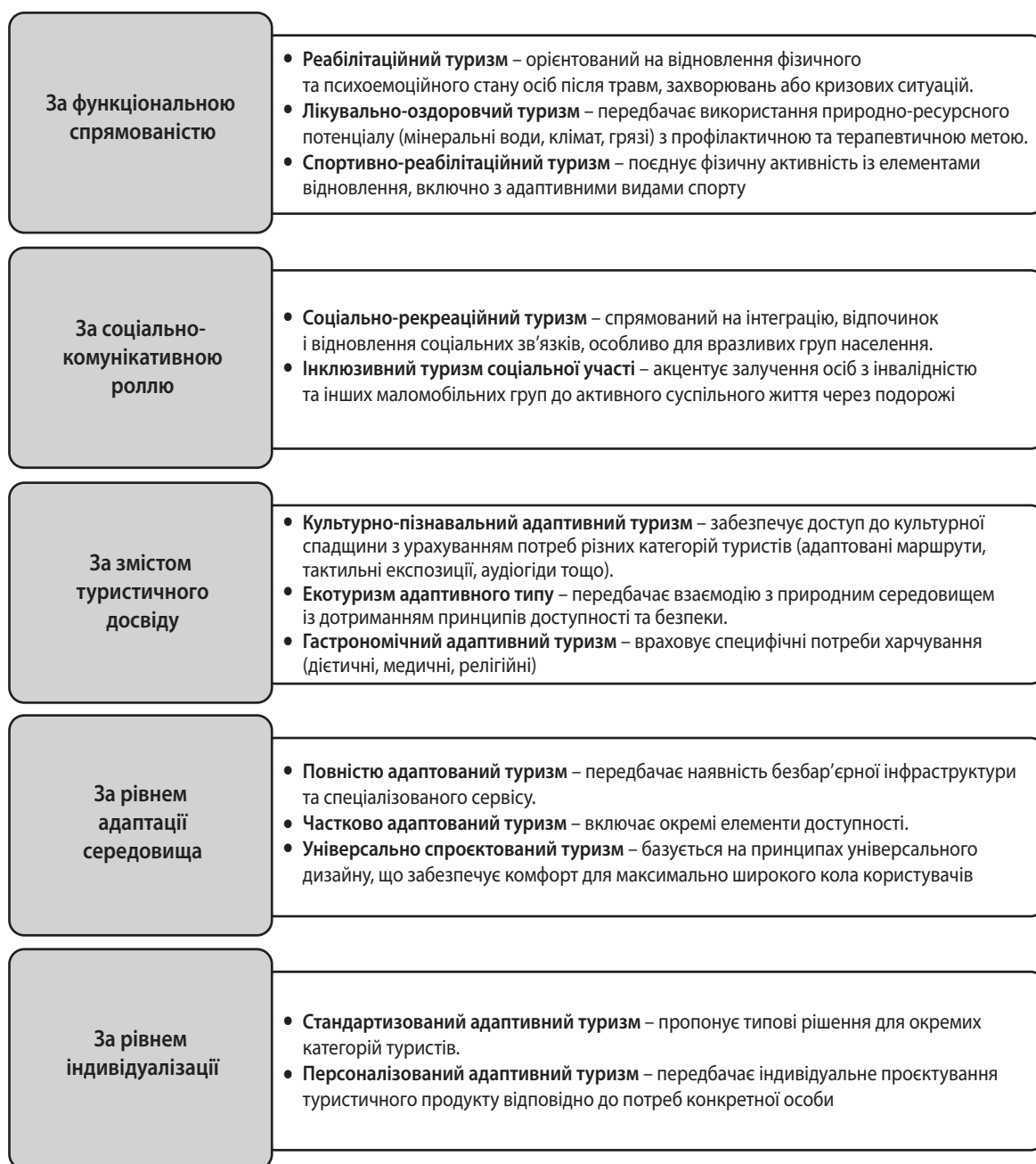
Рис. 2. Види адаптивного туризму залежно від мети діяльності

Як видно з рис. 2, адаптивний туризм доцільно розглядати як ієрархічно структуровану систему, у межах якої окремі види та підвиди вза-