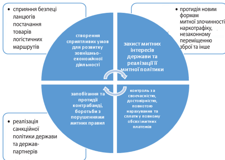
Рис. 1. Доповнення традиційного функціоналу митних інституцій держави новими функціями

До початку повномасштабного вторгнення рф в Україну перетин державного і митного кордону здійснювався водним, наземним, повітряним транспортом, трубопроводами та лініями електропередач через 235 пунктів пропуску та пунктів контролю. Війна проти України спричинила зупин-